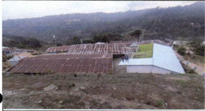
Foto 1: Sustitución de lámina por lámina troquelada aluzinc calibre 26